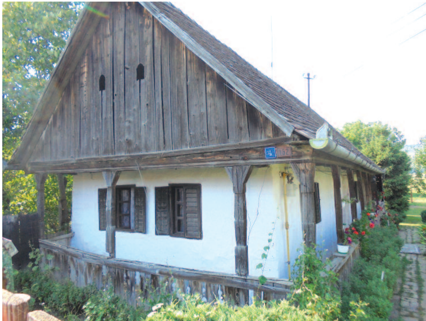
A vámosgálfalvi Ördöngös hídra tekintő kis ház láttatni engedi a Kis-Küküllőre lefutó gyümölcsösökert

Maradok kiváló tisztelettel. Kelt 2018-ben, Szent Mihály havának kezdetén